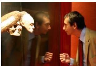
Inauguration du musée du quai Branly, 2006

La société des Amis contribue à faire connaître le musée du quai Branly, à enrichir ses collections et à soutenir son développement. Dès le printemps 2002, 4 ans avant l'ouverture du musée, se constitue un 1 er cercle d'Amis. Présidée par Louis Schweitzer, elle compte près de 800 membres l'année de l'inauguration du musée. En 2014, Lionel Zinsou succède à Louis Schweitzer à la présidence de la société des Amis.