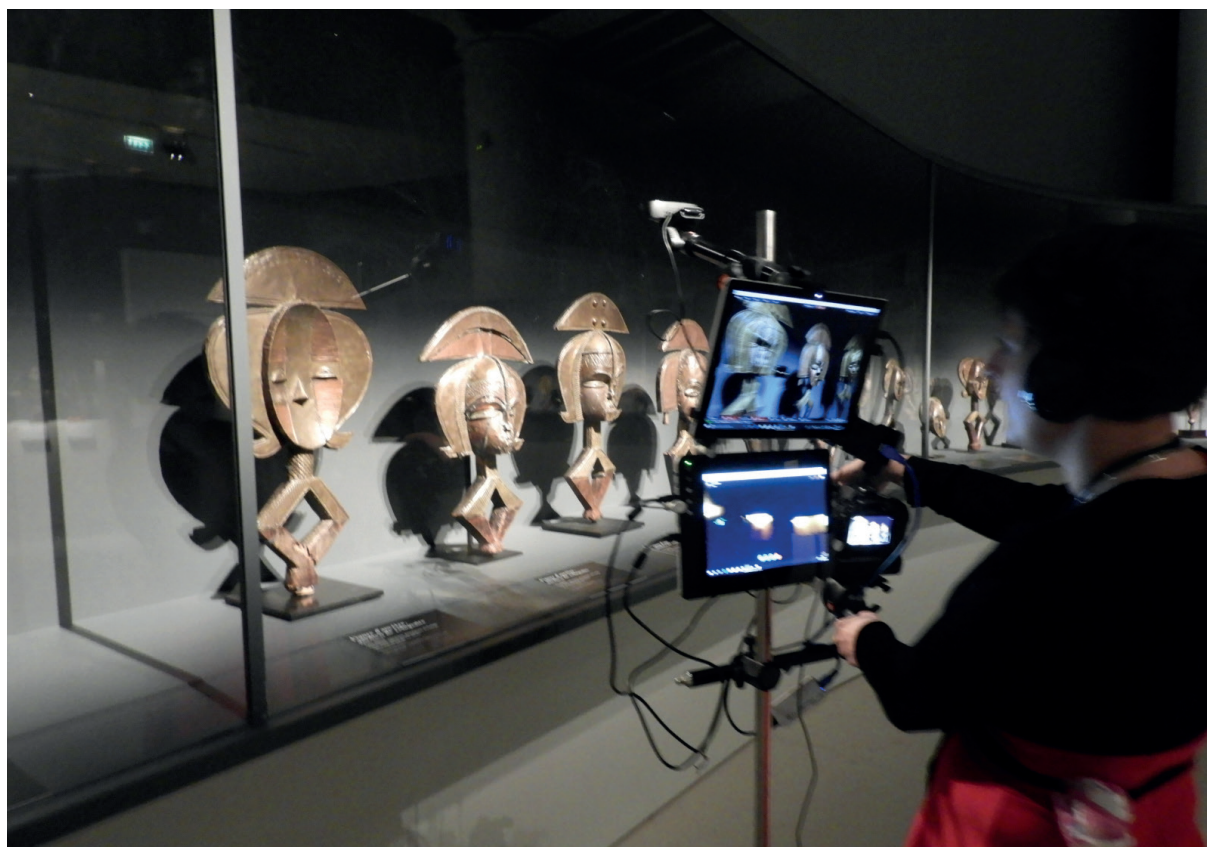
Le dispositif est composé de multiples équipements vidéo et multimédia.