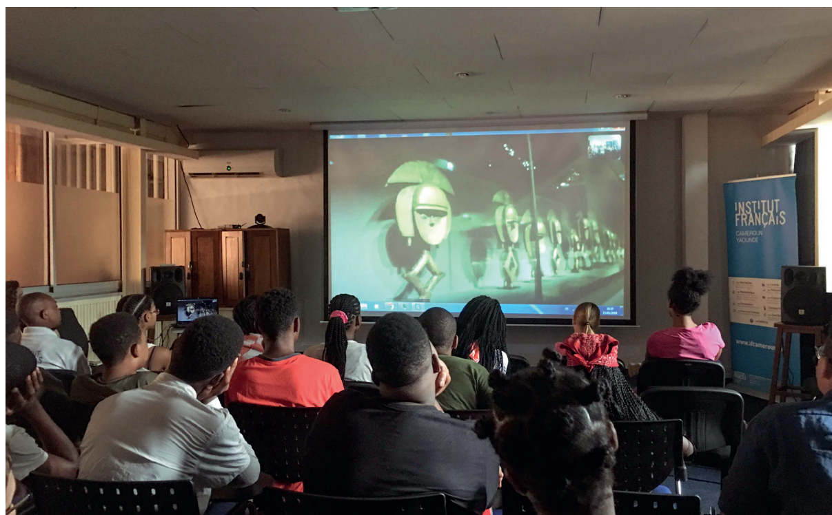
La vidéo est transmise en direct sur le lieu partenaire via skype.