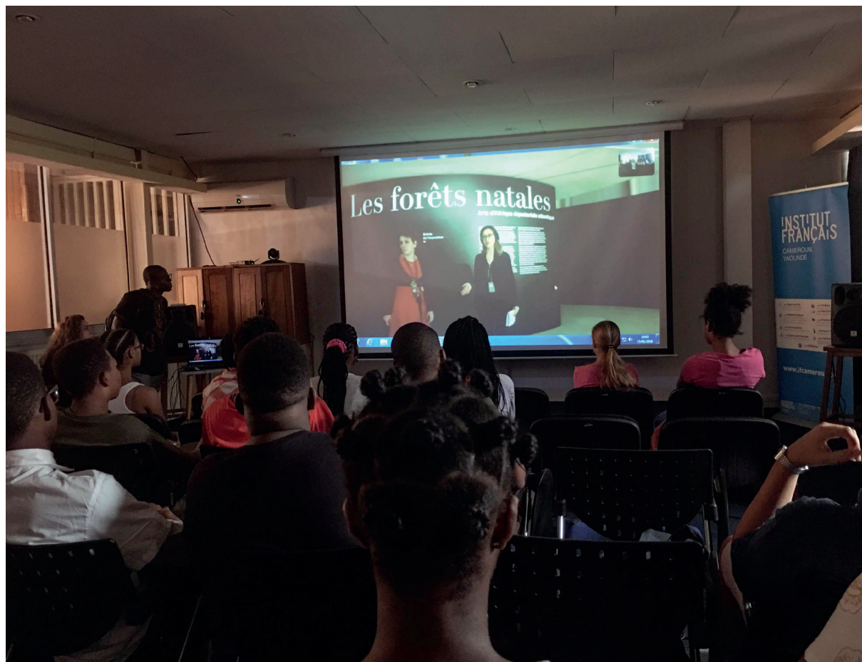
Les web-visiteurs de l'Institut français de Yaoundé commencent leur visite le 15 janvier 2018.