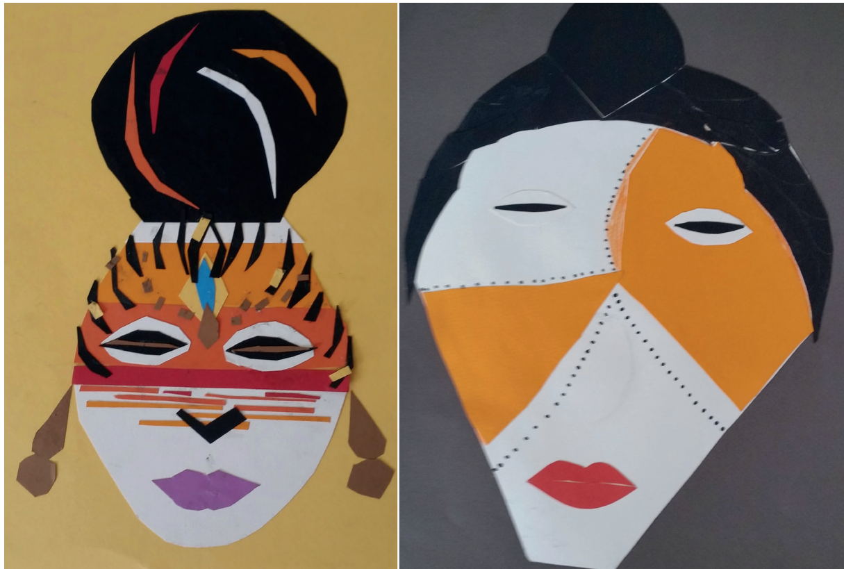
Travaux réalisés par des élèves de 6 e en classe d'arts plastiques après la web-visite du 8 janvier 2018 au lycée français de Port-Gentil.