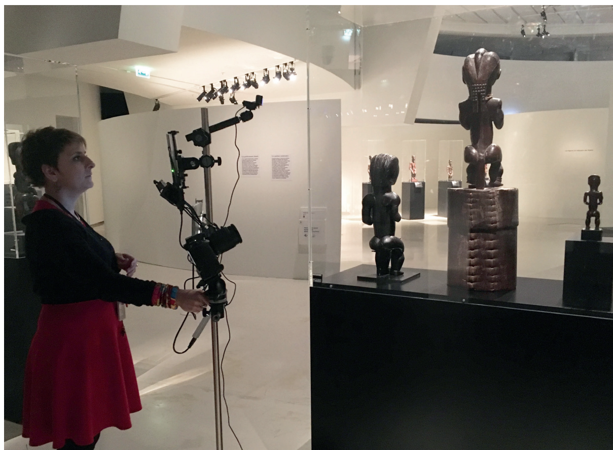
Les caméras permettent de multiplier les points de vue sur les objets de l'exposition.