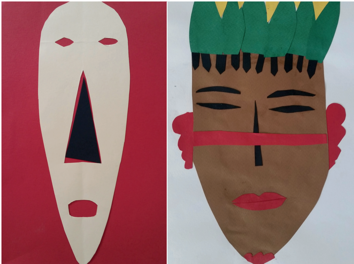
Travaux réalisés par des élèves de 6 e en classe d'arts plastiques après la web-visite du 8 janvier 2018 au lycée français de Port-Gentil.