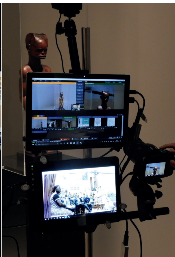
Le matériel du support mobile permet à la fois de transmettre la vidéo au site partenaire et de recevoir l'image du public suivant la visite.