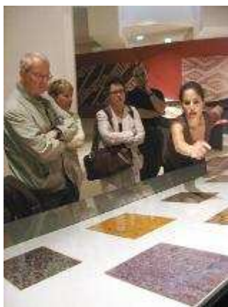
Quelques Amis à la visite de l'exposition « Paracas »