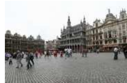
Bruxelles, place Royale, en route vers le musée

Enfin, ce week-end fût l'occasion de découvrir les exceptionnelles collections particulières de Marc Blanpain, de Colette Ghysels, et de Willy Mestach. ■