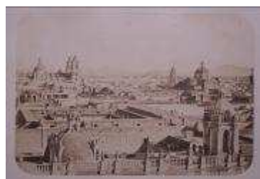
Vue générale de Mexico