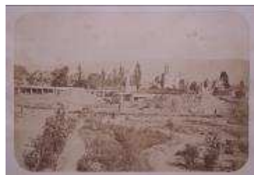
Usine de Tezcoco