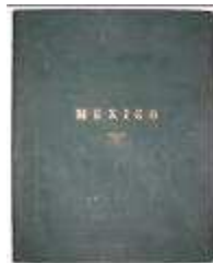
Couverture de l'album