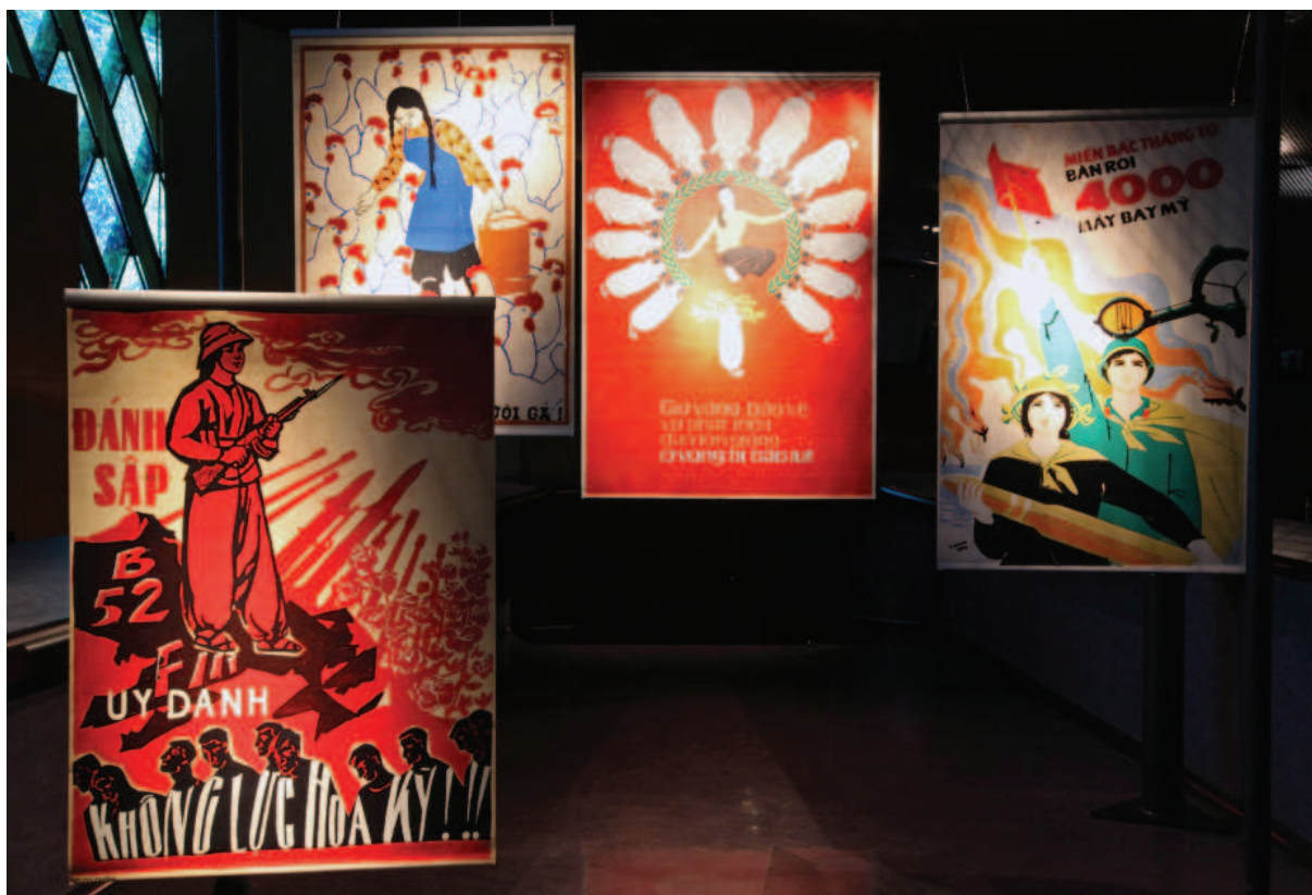
Vue de l'installation Propaganda - les femmes dans la révolution. Vietnam 1954-1980 . De g. à dr. : Abattons les B52 américains, 1972 ; Développons les élevages de poules, 1979 ; Protégeons et développons l'élevage de cochons dans les zones inondées, 1978 ; Le Nord a abattu 4 000 avions US, 1972.

En raison de ce lien étroit avec le musée des Femmes, je n'ai pas rencontré de difficulté pour le prêt des œuvres. Construire cette exposition à l'occasion de l'Année France-Vietnam nous a permis d'obtenir une coopération bilatérale.