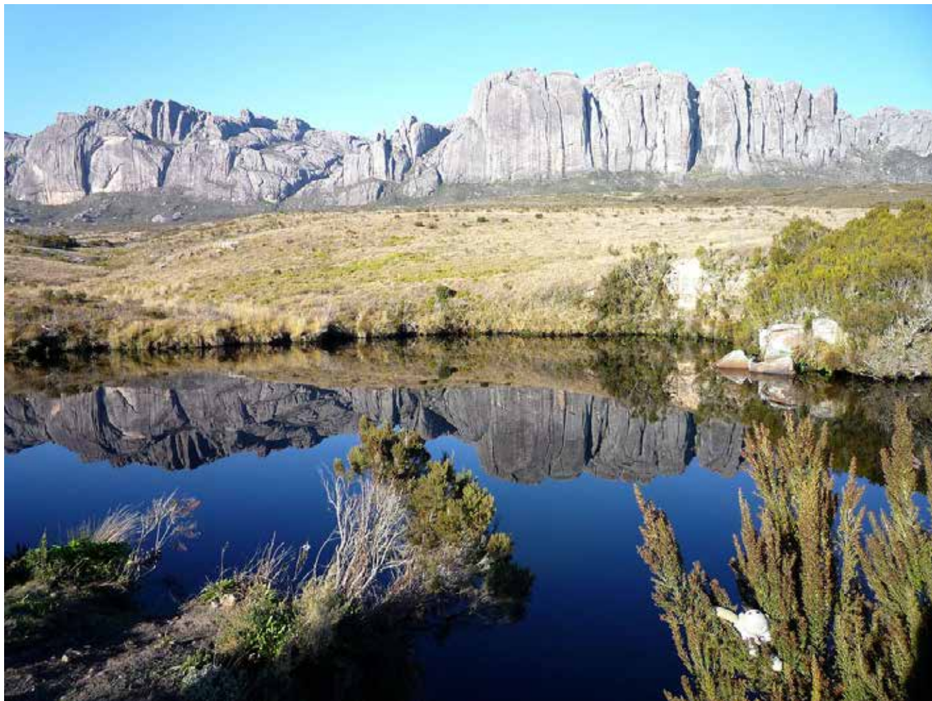
Massifs montagneux d'Andringitra