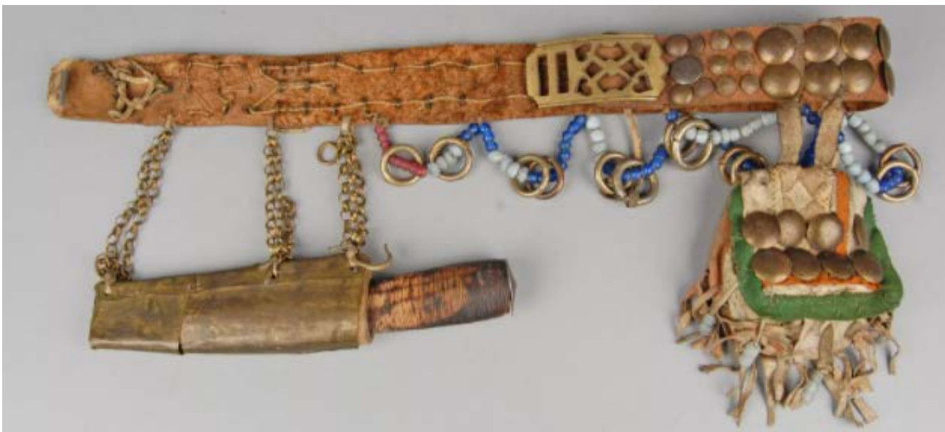
Ceinture avec couteau et sac, en fourrure de renne, tissu, métal et bois. Khanty ou Nenets, Russie, avant 1898.

L'exposition Arctic, culture and climate se tient jusqu'au 21 février 2021 au British Museum. Sous le prisme du climat, elle présente l'histoire des communautés qui peuplent l'immense région polaire arctique qui englobe la Russie, le Groenland, le Canada, les États-Unis et les États scandinaves. Les œuvres exposées proviennent des collections du British Museum et de nombreuses autres institutions internationales. Des pièces contemporaines commandées à des artistes indigènes sont également présentées. L'objectif est double, d'une part mettre en lumière l'adaptabilité hors norme de ces cultures qui s'accommodent d'un environnement particulièrement hostile dont elles tirent leurs ressources, et d'autre part dénoncer les conséquences dramatiques des changements climatiques pour la vie sous ces latitudes, mais aussi sur le reste du globe. Visite virtuelle (en anglais) ICI