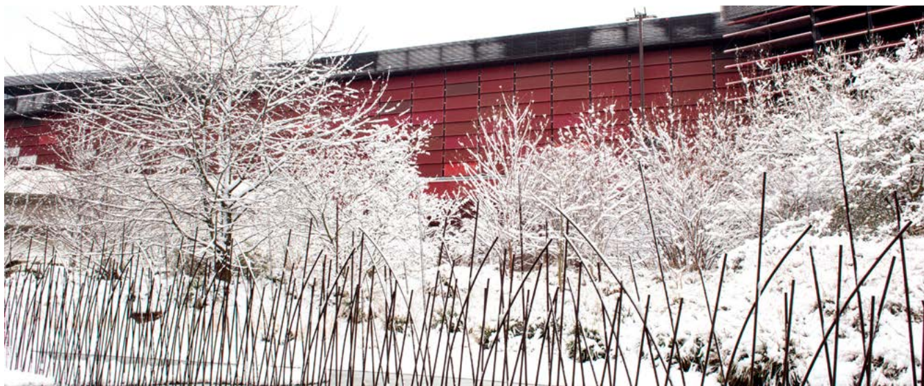
Vue du Jardin du musée du quai Branly - Jacques Chirac sous la neige. Février 2018.