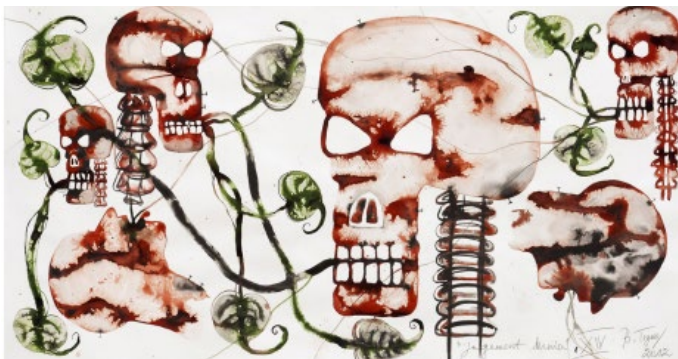
ugement dernier XIV, 2012, Barthélémy Togo © Barthélémy Togo / Courtesy Bandjoun Station et Galerie Lelong & Co. © ADAGP, Paris, 2021

Pour accéder au communiqué de presse, c'est ICI