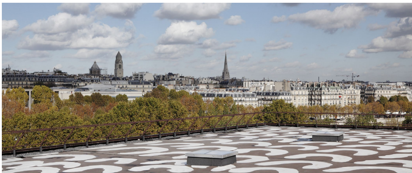
La terrasse panoramique. Œuvre de l'artiste Lena Nyadbi. 5 novembre 2013. Dayiwul Lirlmim (Ecailles de Barramundi), Lena Nyadbi. Ocre et charbon naturels sur toile de lin, 2012. Adaptation d'Art sur le Toit, musée du quai Branly, 2013

© Lena Nyadbi, représentée par le WARMUN Arts Centre