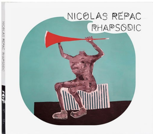
Pochette du nouvel album de Nicolas Repac, « Rhapsodic »

Accéder à la page du label NO FORMAT ICI