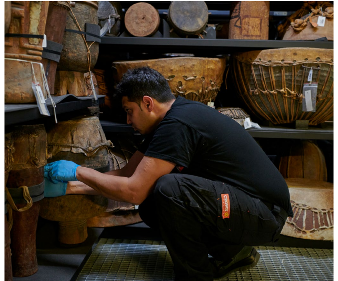
Février 2020. Redéploiement des instruments de musique dans la réserve silo.