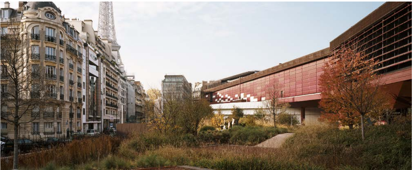
Vue sur le jardin. Automne 2008. Scénographie réalisée par le jardinier, paysagiste et botaniste Gilles Clément.

Restons en lien : rejoignez les réseaux sociaux des Amis