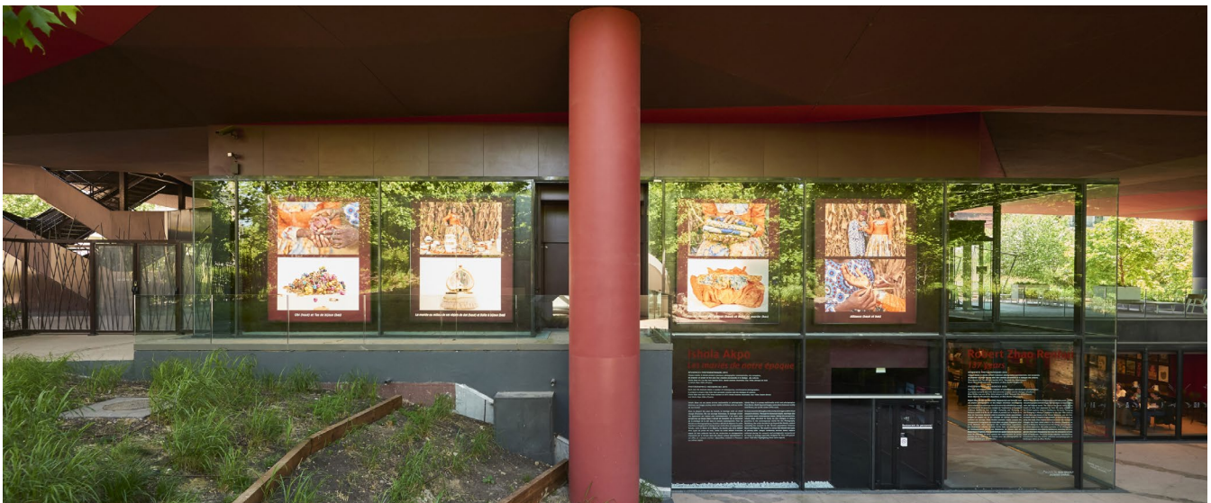
Le bâtiment et le jardin. Le jardin du musée conçu par le paysagiste Gilles Clément a été réalisé grâce au mécénat de la Fondation d'entreprise ENGIE.

Rappel visioconférences : visites virtuelle Olmèques