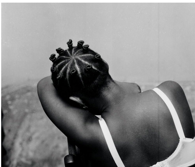
James Barnor, Untitled, Studio X23, Accra, 1975

La galerie consacrera, à partir du mois de mai, une exposition pour mettre à l'honneur le travail du photographe ghanéen James Barnor.