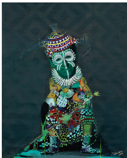
Sans titre, série « It's My Kings », TSHINDELE Pathy 2012

Nous vous proposons de plonger au cœur de l'exposition Ex Africa avec le cycle de podcast éponyme coproduit avec Society décrypte les présences africaines dans l'art d'aujourd'hui.