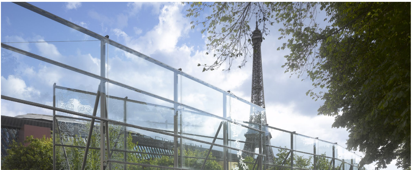
Le bâtiment musée, Juillet 2015.

Bourse de Master 2 – Caroline et Georges Jollès – 2021-2022