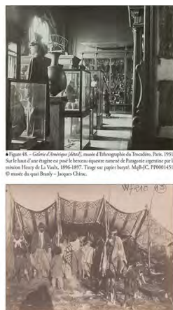
III | Promesses de Patagonie