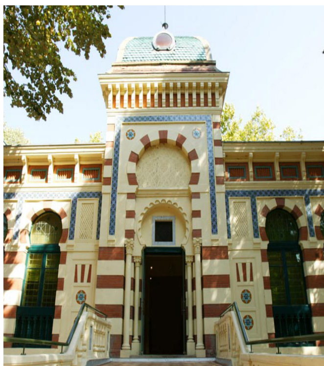
Entrée du musée Georges-Labit © Musée Georges-Labit

Source : site officiel du musée Georges-Labit ICI