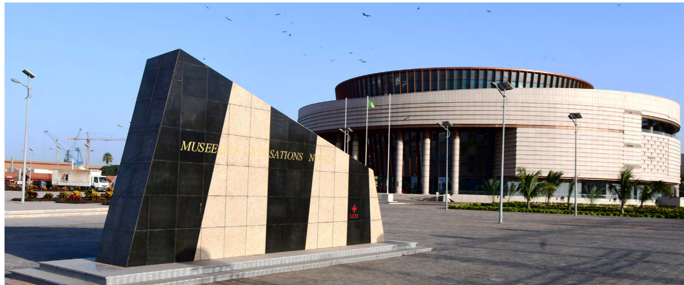
Musée des Civilisations Noires

Inauguré en 2018, le musée présente l'histoire de l'Afrique en un même lieu et possède des objets datant de l'ère préhistorique, comme des vestiges des premiers hominidés apparus en Afrique il y a plusieurs millions d'années au Tchad et en Éthiopie ainsi que des masques rituels venus des quatre coins de l'Afrique et même du monde. Sur les murs, l'on peut admirer des notions de mathématiques, de médecine et d'architecture qui rappellent la contribution de l'Afrique au patrimoine culturel et scientifique mondial.