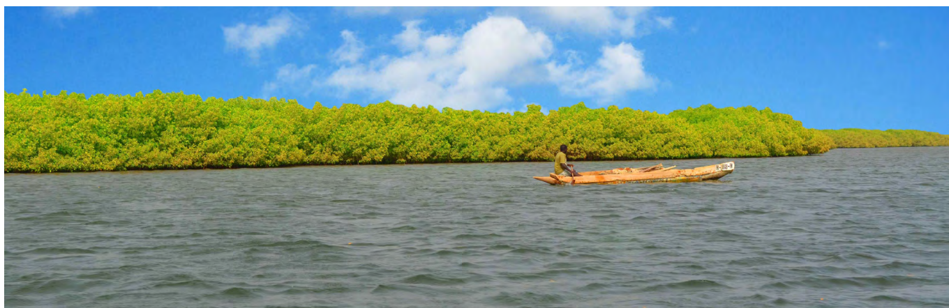
Pirogue sur le Saloum

* Sources - Les textes descriptifs proviennent des sites internet ci-dessous : unesco.org - jeuneafrique.com - mahicao.org - wikipedia.org - keurcity.com - planete-senegal.com