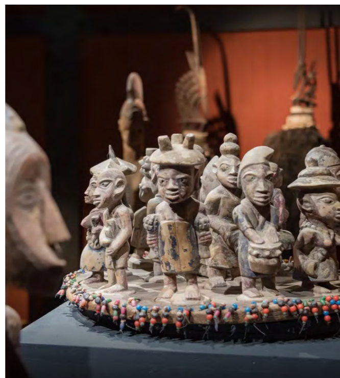
Musée Mahicao

Objets archéologiques, masques, sculptures, outils, costumes, textiles, bijoux, depuis le néolithique jusqu'au milieu du xx e siècle, sont présentés au long de quelque 500m 2 de vitrines et d'installations.*