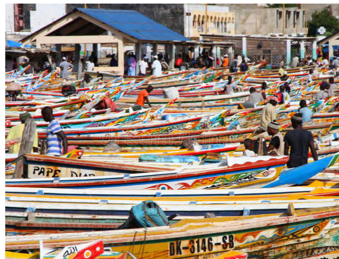
En haut : Sandaga Market @sandakar, Facebook En bas : Les pirogues à quai à Sombédioune, Sénégal, 16 septembre 2017. (VOA/Seydina Aba Gueye)