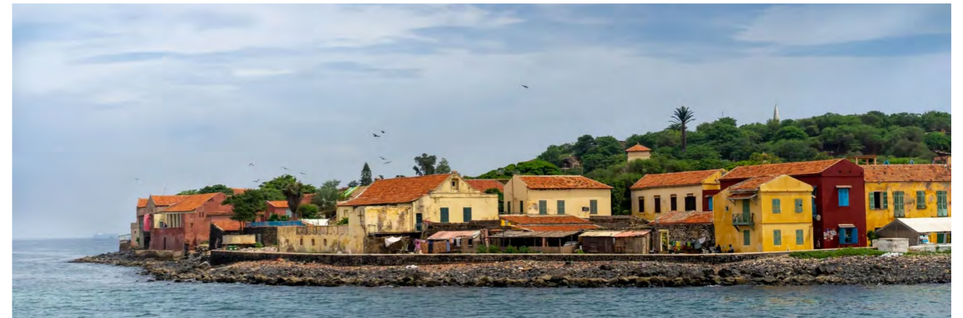
Île de Gorée, Dakar, Sénégal

Gorée est assurément un lieu de mémoire mais aussi un havre de paix dont les couleurs et le charme attirent les artistes en résidence et les visiteurs d'un jour.*