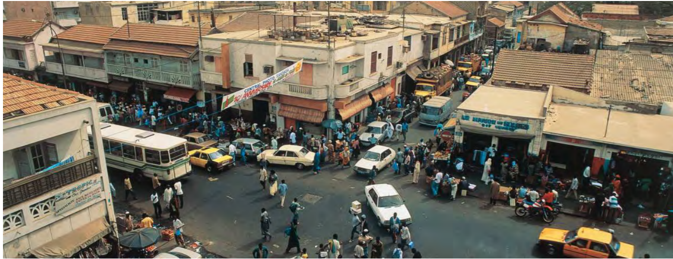
Le marché de Dakar

Capitale de la République du Sénégal, Dakar est une des plus grandes villes d'Afrique (1,5 millions d'habitants sur les 3,6 millions de l'ensemble de l'agglomération). Favorisée par sa situation à l'extrémité de la presqu'île du Cap-Vert, Dakar s'est développée au gré de l'essor du commerce avec le Nouveau Monde et l'Europe. Elle concentre aujourd'hui 80% de l'économie du pays.