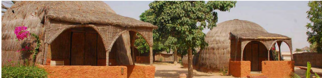
Eco lodge de Simal

La présence d'un écosystème particulier et notamment de marigots, mangroves, lagunes, bancs de sable, innombrables petites îles, baobabs, palmiers-roniers créent des paysages variés animés par de petits villages de pêcheurs sérères et une riche faune, en particulier aviaire.*