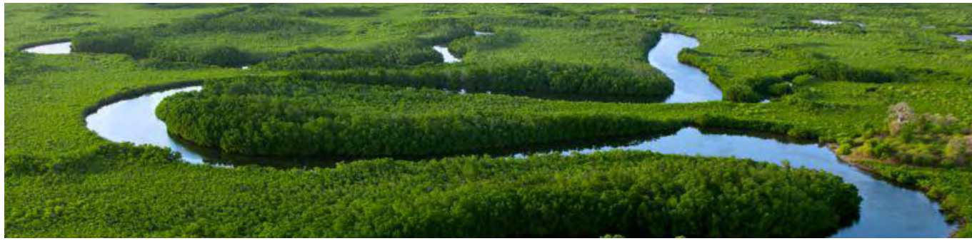
Delta du Saloum

Le Delta du Saloum, inscrit au Patrimoine Mondial de l'Unesco depuis 2011, est l'une des plus belles régions du Sénégal, située juste au Nord de la Gambie au point de confluence de deux fleuves, le Sine et le Saloum, et de la mer.