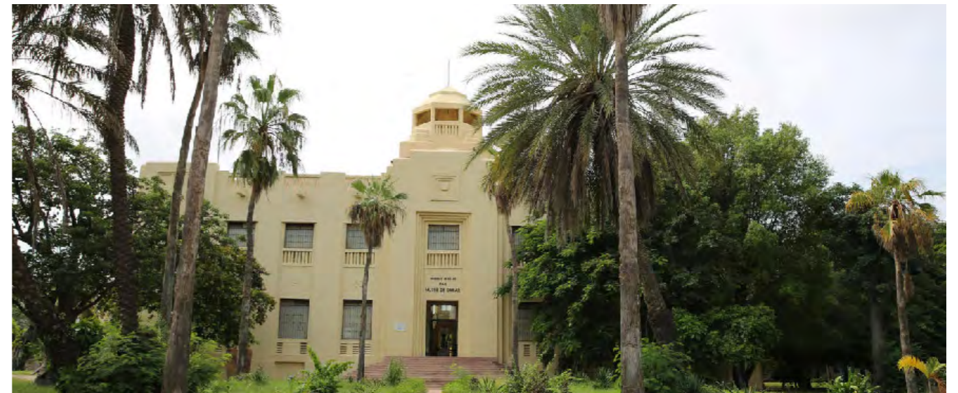
Musée de l'IFAN