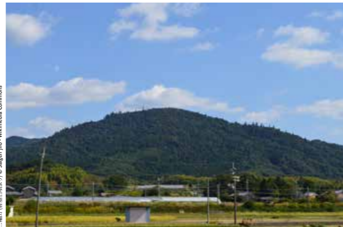
三輪山 (奈良県天理市)

Une belle journée de découverte des paysages ruraux japonais avec une excursion dans les villes d'Asuka et Yoshino. Asuka dans la matinée nous servira d'introduction à l'archéologie japonaise. Nous partirons à la découverte des anciennes tombes kofun (datées d'entre le III e et le VII e siècle) de Makimuku , d' Ishibutai et de Kitora .