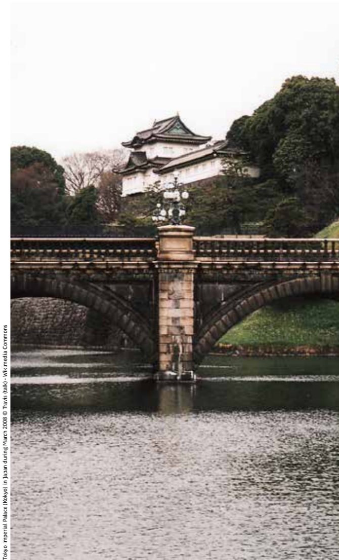
Tokyo Imperial Palace (Tokyo) in Japan during March 2008