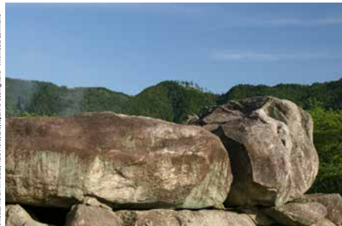
Ishibutai Kofun in Asuka, Nara Prefecture, Japan