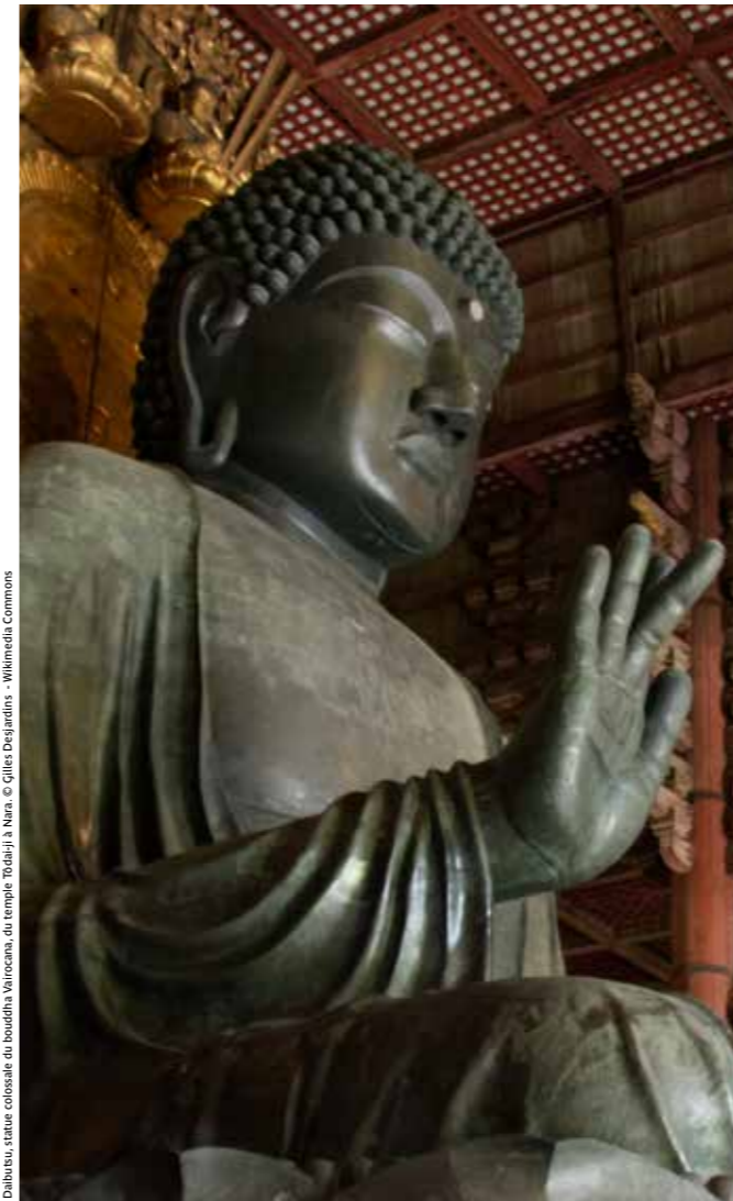
Daibutsu, statue colorée du bouddha Vairocana, du temple Tōdai-ji à Nara