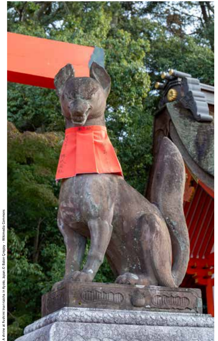
A shrine at Fushimi Inari-taisha in Kyoto, Japan

Après une visite du temple bouddhiste Sanjūsangen-dō à Kyoto, cap sur les paysages vallonnés de la région, ponctués par d'impressionnants sanctuaires comme Fushimi ainsi que par l'ancienne capitale Nara. On prend ici le pouls du vieux Japon, où se côtoient de nombreux temples qui attestent de l'essor du bouddhisme. Nous visiterons entre autres le plus grand temple en bois du monde Tōdai-ji , et son célèbre Grand Bouddha Daibutsu , ainsi que Nigatsu-dō et Sangatsu-dō , typiques de l'ère Tenpyō . En fin d'après-midi, nous ferons une halte au sanctuaire Fushimi , haut lieu shintoïste où les impressionnants torii vermillons s'alignent à perte de vue.