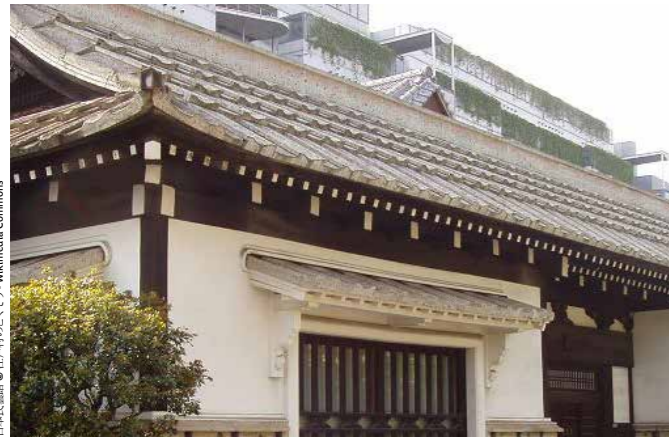
日本建築