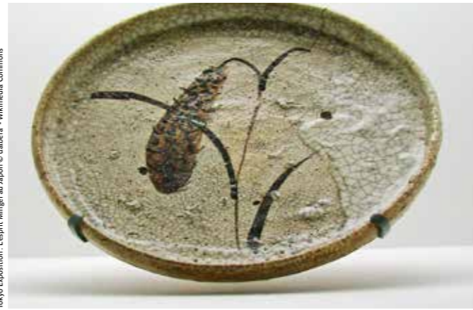
Tokyo Exposition: L'esprit Mingei au Japon

Dernière matinée à Tokyo consacrée au musée Mingei .