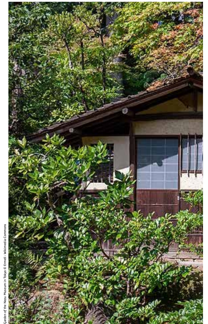
Garden of the Nezu Museum in Tokyo

L'aventure de Tokyo continuera avec une découverte de ses quartiers emblématiques. La matinée sera dédiée à la visite du cœur historique de la capitale japonaise, entre le double pont du palais impérial (où se trouve l'actuelle résidence impériale), le quartier administratif de Kasumigaseki et le sanctuaire controversé de Yasukuni , qui rend hommage aux Japonais morts pour l'Empire.