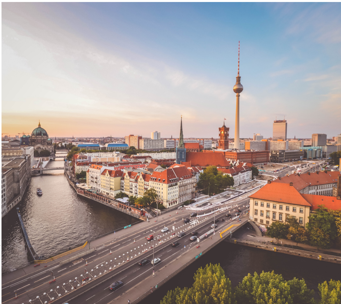
Vue de Berlin

DU VENDREDI 24 AU DIMANCHE 26 NOVEMBRE 2023