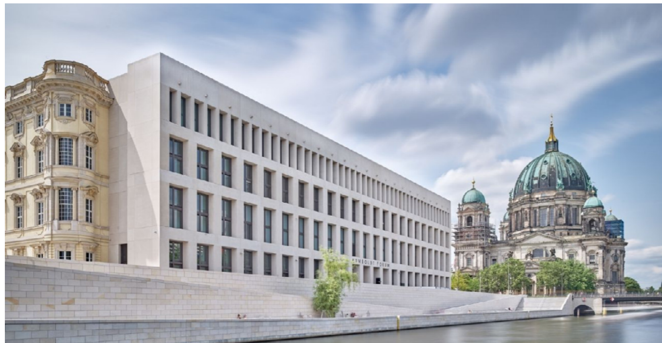
Stiftung Humboldt Forum im Berliner Schloss

Le Humboldt Forum, situé dans le château de Berlin reconstruit, a été achevé et inauguré entre 2020 et 2021. Ce bâtiment a permis de créer un nouveau Centre pour la culture et la science, en plein cœur de Berlin. Ce nouveau Centre abrite plusieurs structures : le musée d'Ethnologie et le musée d'Art asiatique, l'exposition permanente Berlin Global, l'université Humboldt avec un laboratoire et la fondation du Forum Humboldt, qui accueille des expositions temporaires et des événements.